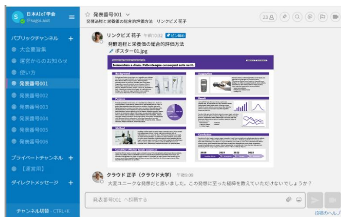
ポスターセッションチャンネル上での質疑応答（イメージ）

「ポスターセッションプラン」のほか、大人数ビデオ会議を設定できる拡張プラン「ビデオPack」や「ウェビナーPack」も導入できるので、基調講演や学会後の交流懇親会など、ニーズに合わせて利用できます。